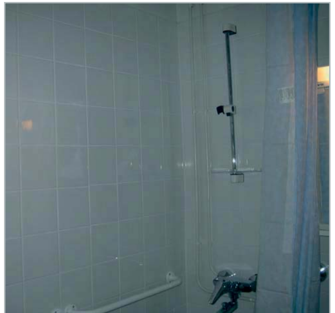
Kunnostettu wc- ja suihkutila.

Kosteiden tilojen valmistuttua kuivien tilojen tapetit poistettiin ja maalatut pinnat pestiin ja hiottiin. Katot maalattiin kauttaaltaan. Keittiökalusteet hiottiin ja maalattiin. Makuuhuoneen ja olohuoneen ikkunaseinät ja eteisen sekä keittiön seinät maalattiin. Olohuone ja makuuhuone tapetoitiin. Viimeisenä työvaiheena ennen loppusiivousta ja turvalieden asentamista asennettiin vielä lattialaminaatti listoituksineen.