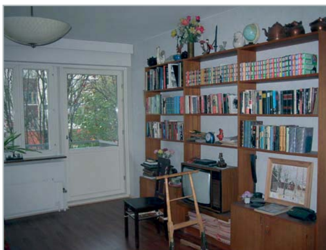
Kauttaaltaan pinnoitettu olohuone.

Hankkeen suunnitteluvaiheessakin asukas oli vielä vastaan toteutusta, vaikka rahoitus olisi saatu sataprosenttisestikin. Hän kuitenkin suostui korjauksiin ja osallistui rahoitukseenkin, siltä osin kun ei voitu saada tukea muulta taholta.