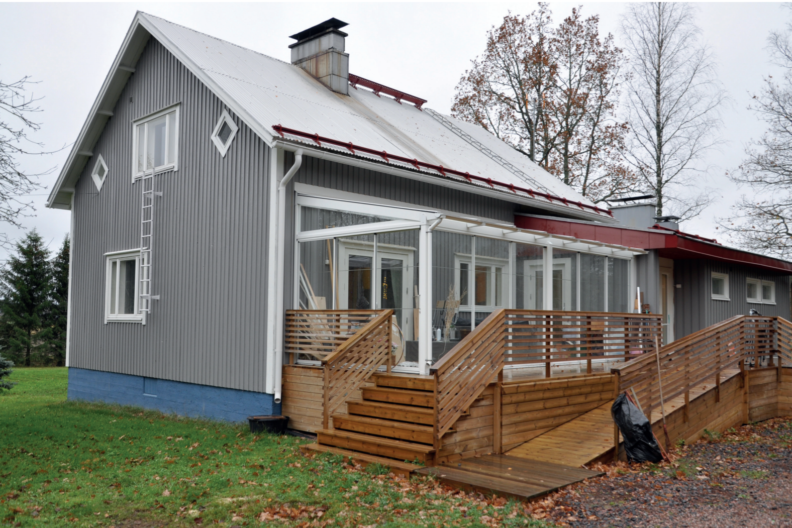
Talo ulkopäin, uusi terassi ja luiska.

Paljon remonttia tehty Pirkon kotiin ja aikaa tämä on vienyt. Nyt olisi vielä keittiön vuoro päästä remonttiin. Vanhat kaapit ovat hankalia käyttää, on korkeaa yläkaappia ja heikosti toimivaa vetolaatikkoa. Lisäksi kodinkoneet ovat tulleet elinkaarensa päähän. Joten vielä