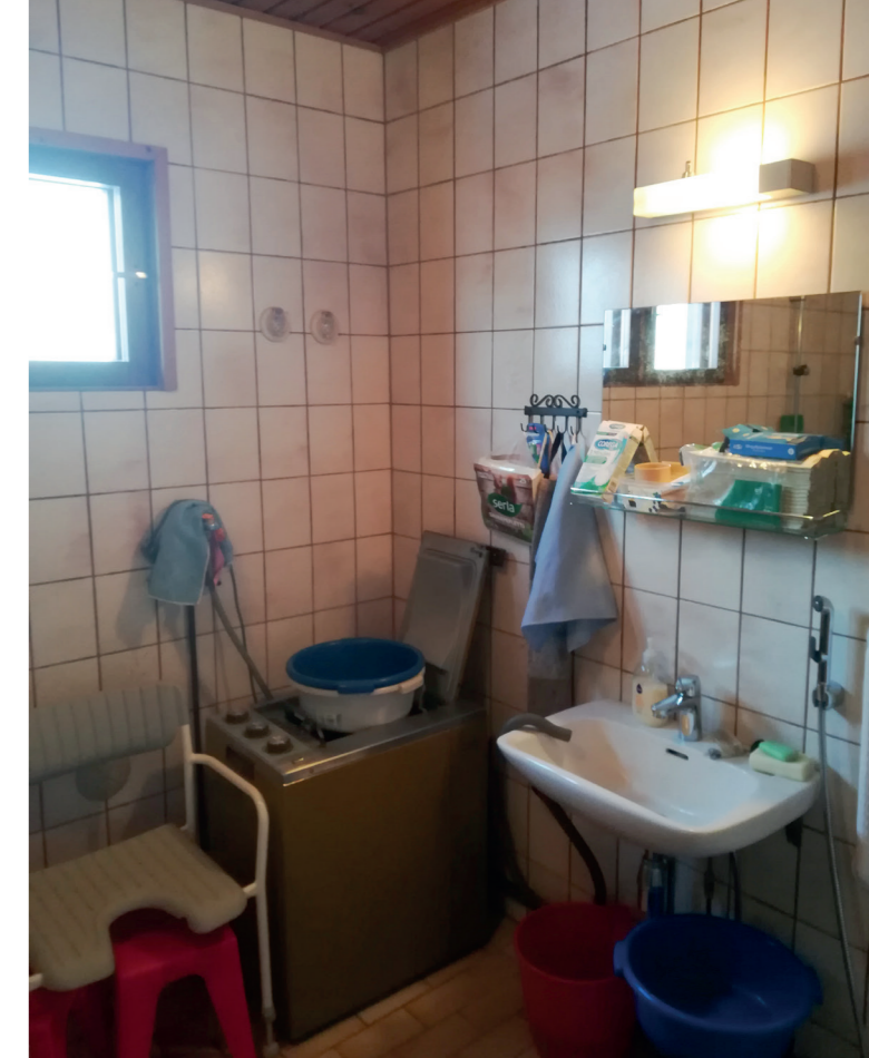
Pesuhuoneen kalusteiden ja laitteiden ahdas sijoittelu haittasivat käytettävyyttä ja turvallista liikkumista.