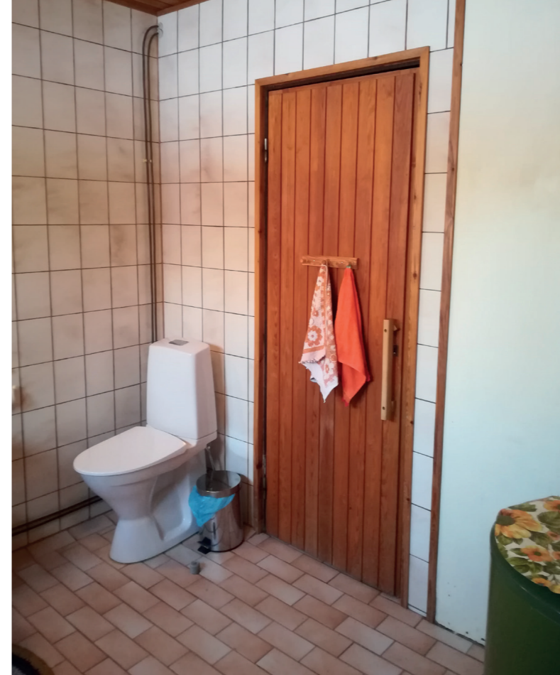
Ennen korjausta WC-istuin sijaitsi ahtaassa kulmassa. Pesuhuoneen ovi oli liian kapea rollaattorin kanssa liikkuvalla.